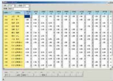
勤務シフト設定画面